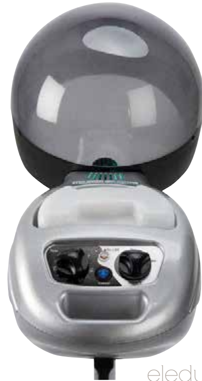
eleduck 375 oz